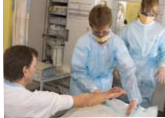
Det, der gjorde mest indtryk på mig, var, da en sygeplejerske skiftede et stort sår på patientens arm. Vi skulle have overtrækskittel, maske og handsker på.

På røntgenafdelingen kan du se, hvordan man tager røntgenbilleder af hele kroppen. Fx knogler, hjerne, blodkar, nyrer m.m. Du ser også, hvad CT- og MR-scanning er. Radiografen har ansvaret for omsorgen til patienten under undersøgelsen. De styrer det højteknologiske apparatur og sikrer optimal billedkvalitet.