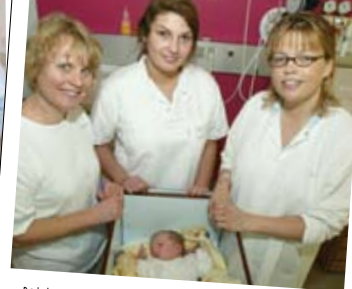
Det har været en kanon uge på barselgangen. Kontakten til de nybagte mødre var det, der gjorde mest indtryk på mig. Man tager del i deres liv.